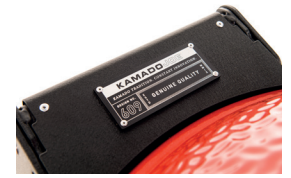
Hing Air Lift