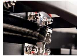
Roostevabast terasest lukustusriiv