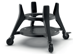
Kvaliteetne ratastega alus