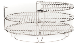
Divide & Conquer® süsteem