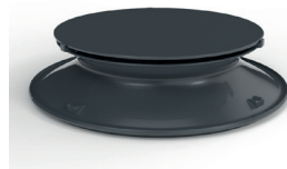
Patenteeritud hüperboolne sisend